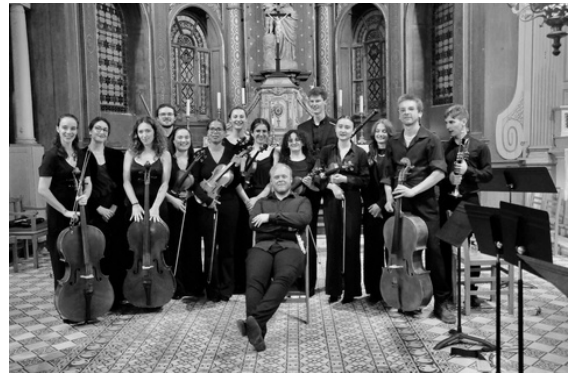
Concert du 29 juin 2024